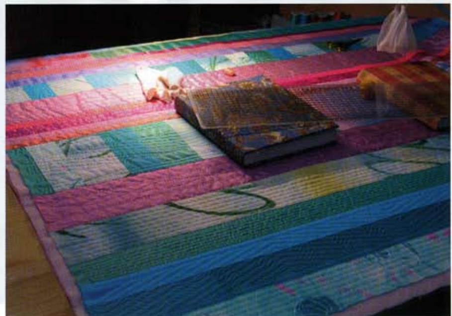
Der Quilt „Soft-Eis“ ist im Fertigwerden