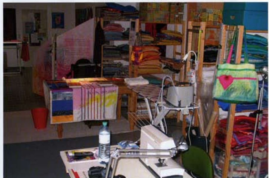
Ein Blick in das Atelier von Renate Dehrberg